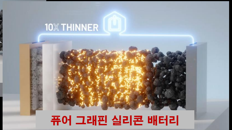
퓨어 그래핀 실리콘 배터리